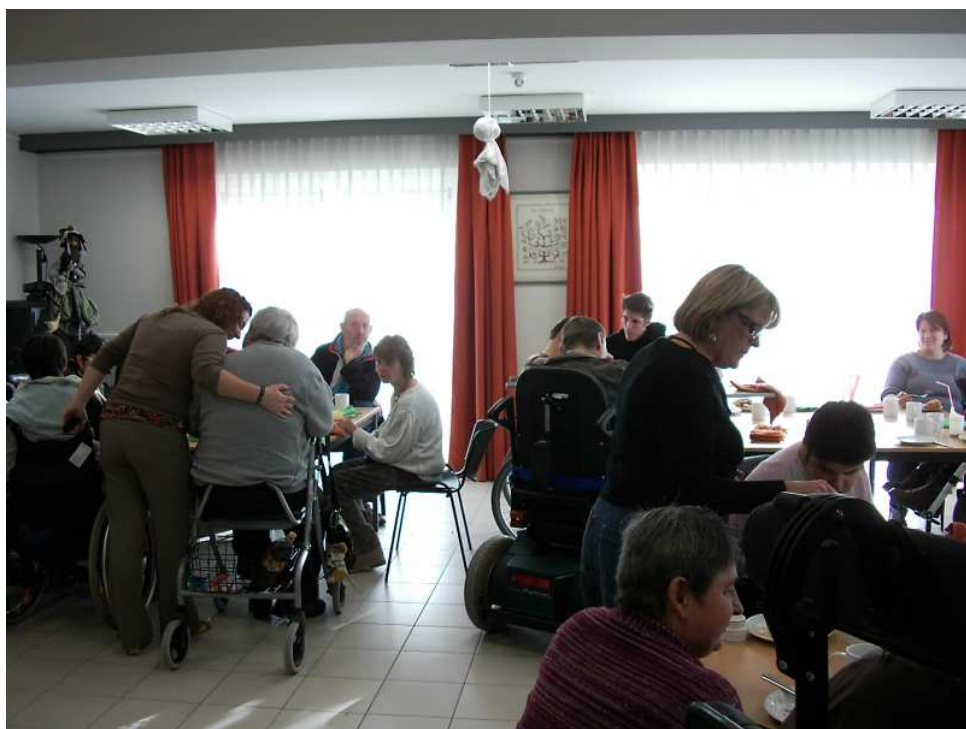
De 4 groepen (Zonnebloem, Sterrewijzer, Levensboom en De Windroos) genieten samen met de begeleiding van het uitgebreide ontbijt.